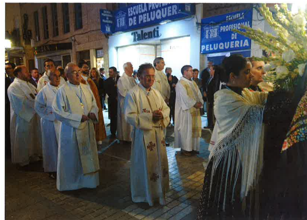
El autor de este artículo preside (con capa pluvial) la procesión de la Virgen, junto a otros sacerdotes, el pasado año.