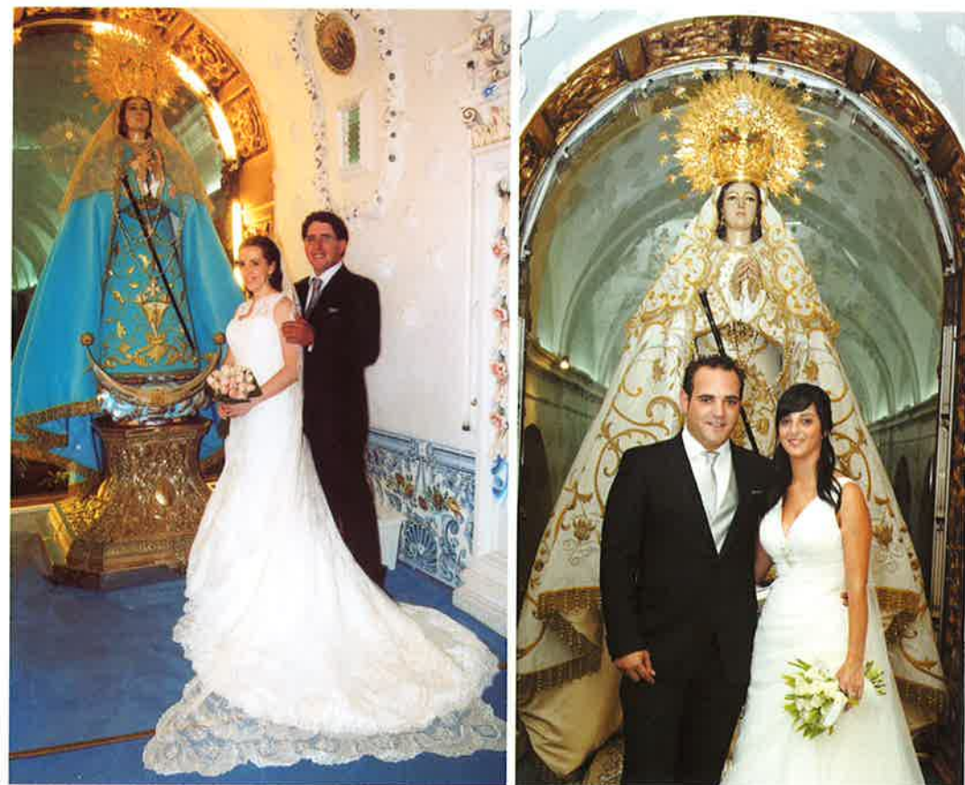
Como en Caná, los jóvenes esposos invitan a su boda a la Virgen y lo manifiestan fotografiándose con Ella.