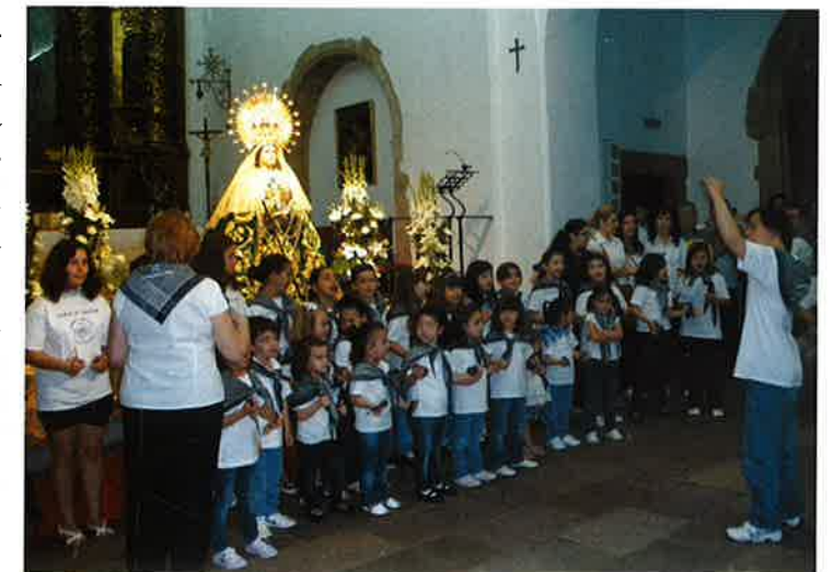
La Virgen durante el Besamanos recibe el homenaje de los niños que le cantan.