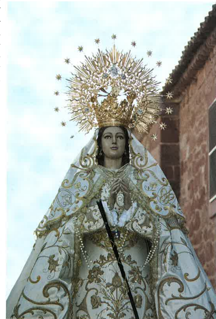
La Virgen en su salida extraordinaria el pasado 13 de agosto, con motivo de la JMJ