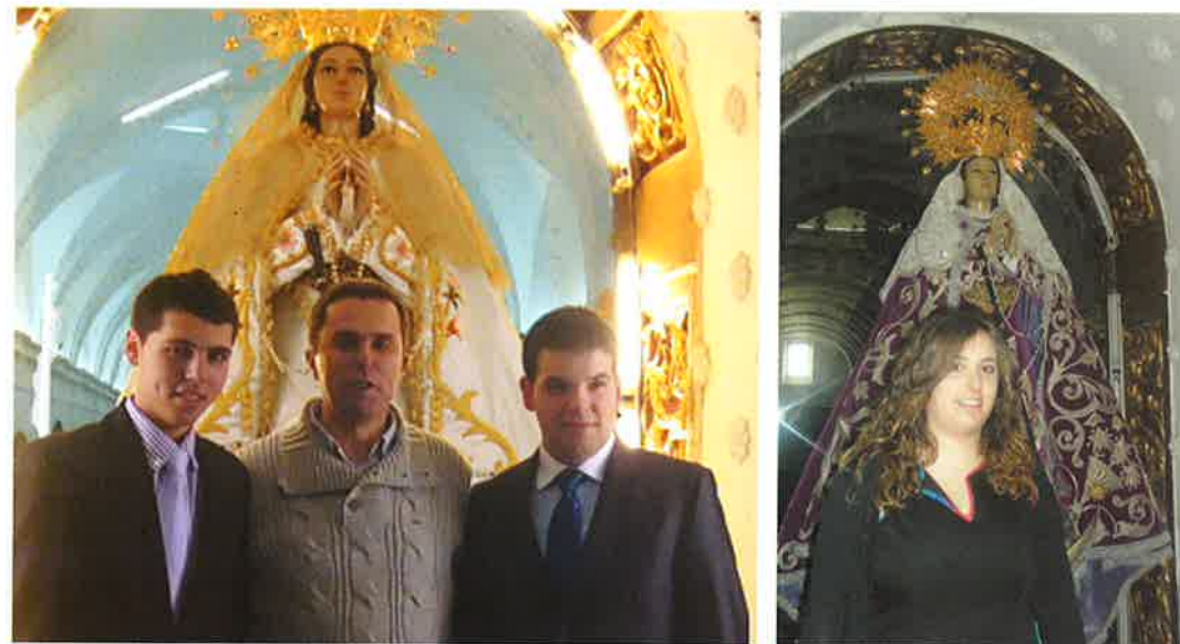
También, los jóvenes acuden a fotografiarse con la Virgen del Rosario, con motivo de su Confirmación.