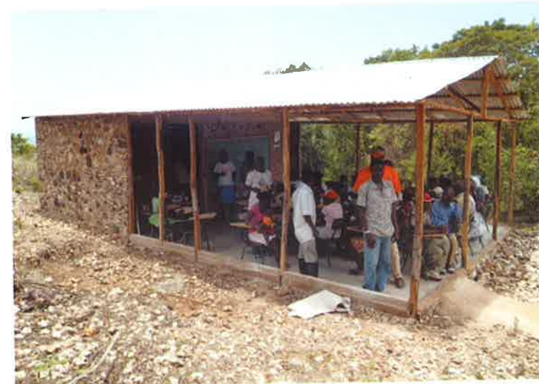
Escuela La Manigua

Las escuelas están usando una enramada construida por la parroquia en cada una de las comunidades de La Manigua, El Manacle, el Km 20-La Seiba y el Mogo-te. Se utiliza la enramada para sus reuniones del Comité de Derechos Humanos y para las celebracio-