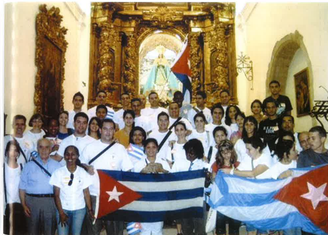
Cubanos participantes en la JMJ vinieron a Alcázar, cantaron una salve a su patrona y se fotografiaron con Ella. El autor de este artículo tenía deseos de que “sus cubanos visitaran Alcázar y La Mancha” se cumpliera el deseo.