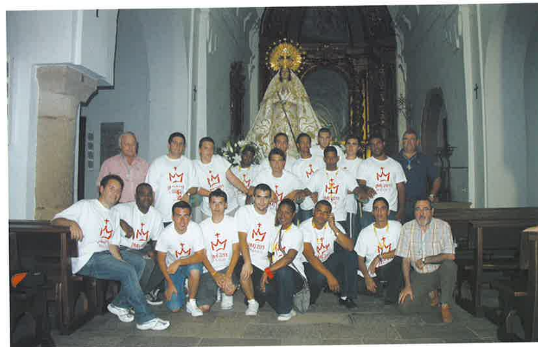
Los jóvenes participantes en la Jornada Mundial de la Juventud se disponen a sacar la Imagen de la Virgen del Rosario, Patrona de Alcázar a la Plaza donde se celebró el encuentro arciprestal de los acogidos.