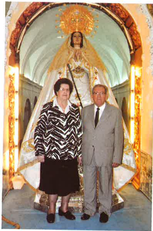
Bodas de Oro: Dos parejas se fotografían con la Virgen, lo mismo que hicieron hace 50 años.