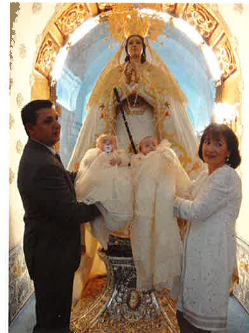
Los padres y los niños recién bautizados en el Camarín con la Virgen del Rosario.

A la Virgen del Rosario 2011 Publicación número 71