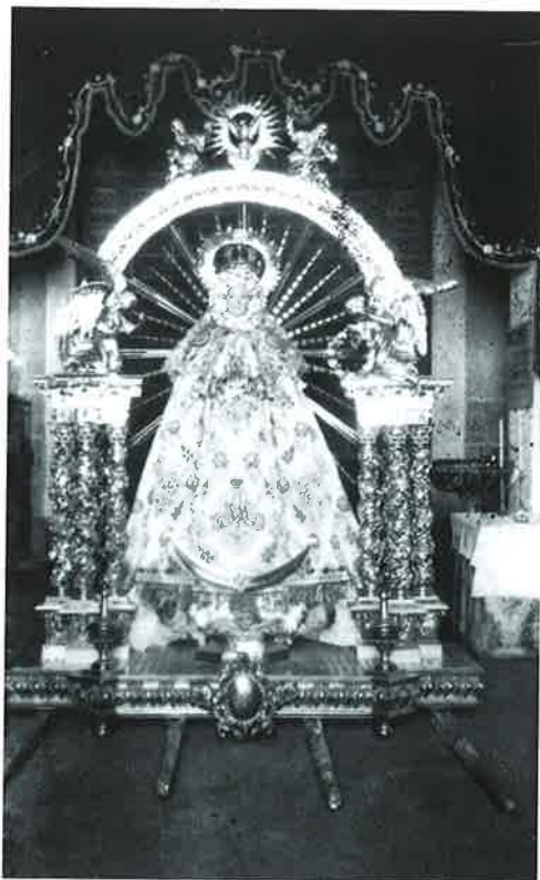
Añeja foto de la Virgen del Rosario (data de 1905).

nes católicas de la comunidad, ellos semanalmente, dirigidos por un catequista y yo mensualmente, que es cuando puedo visitarlos, al tener varias comunidades más que atender. Las celebraciones suelen ser en Kreol, el idioma que hablan; las preparan muy bien con muchos cantos, haciendo algunas danzas y presentación de ofrendas, sobre todo en las fiestas más importantes. Estas escuelas son muy sencillas, pero prestan un buen servicio a esta población inmigrante que no disponen de luz, agua potable, ni siquiera letrinas en su entorno. En muchas ocasiones tenemos que ayudar a los niños comprándoles también los cuadernos y lápices para que puedan hacer sus tareas. El mes de julio pasado llevé a los niños y a algunos familiares, por primera vez a bañarse en el mar, que pueden mirar desde la montaña en que viven pero que no conocían de cerca. Fue para ellos una experiencia muy agradable.