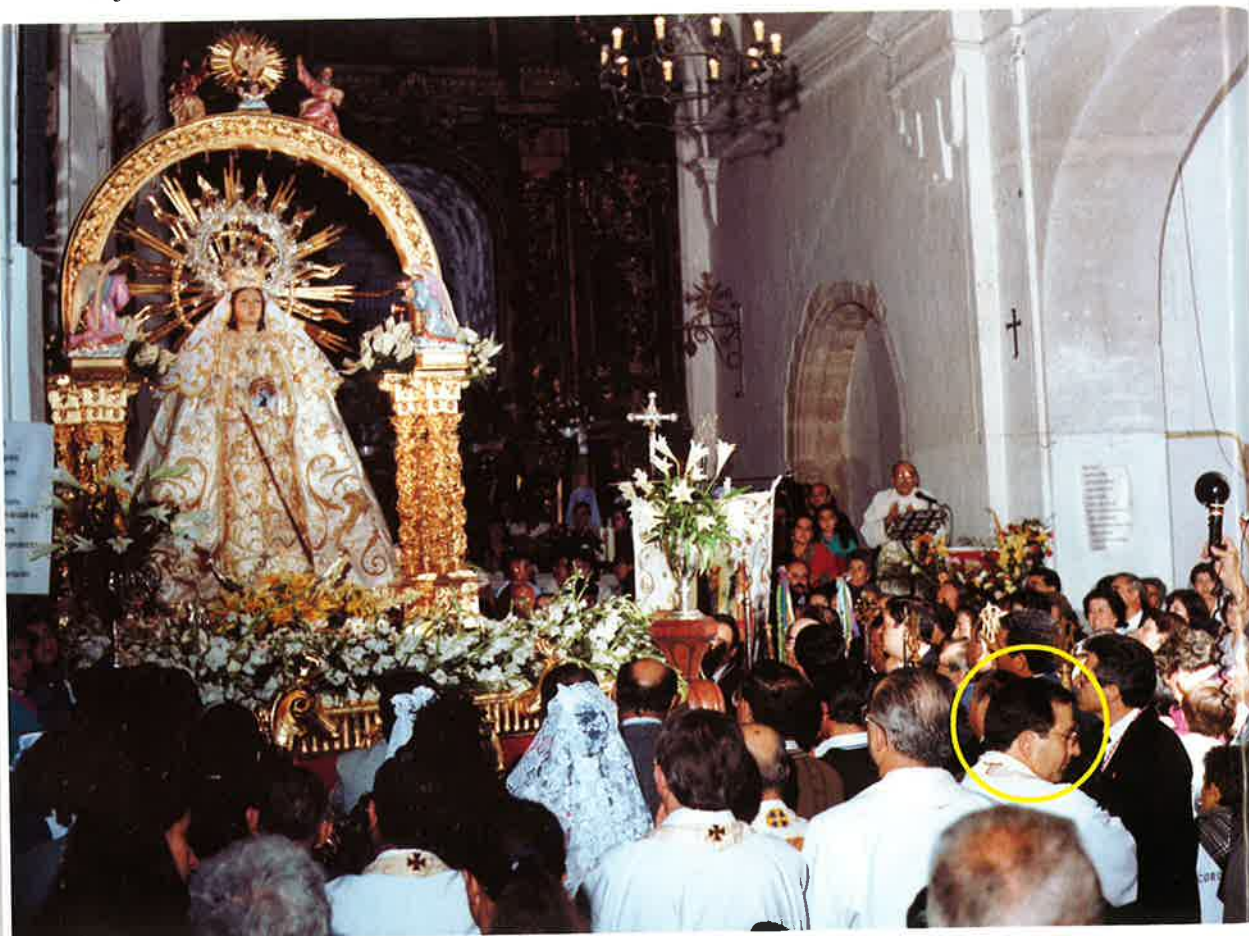
El autor de este artículo aparece en la foto al finalizar la procesión de la Virgen, hace veinte años.