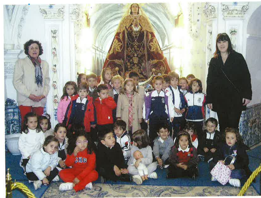
Alumnos del colegio de la Sagrada Familia de nuestro pueblo en su peregrinación al Camarín de la Virgen