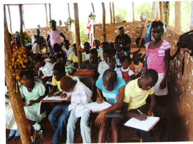
Escuela El Manacle