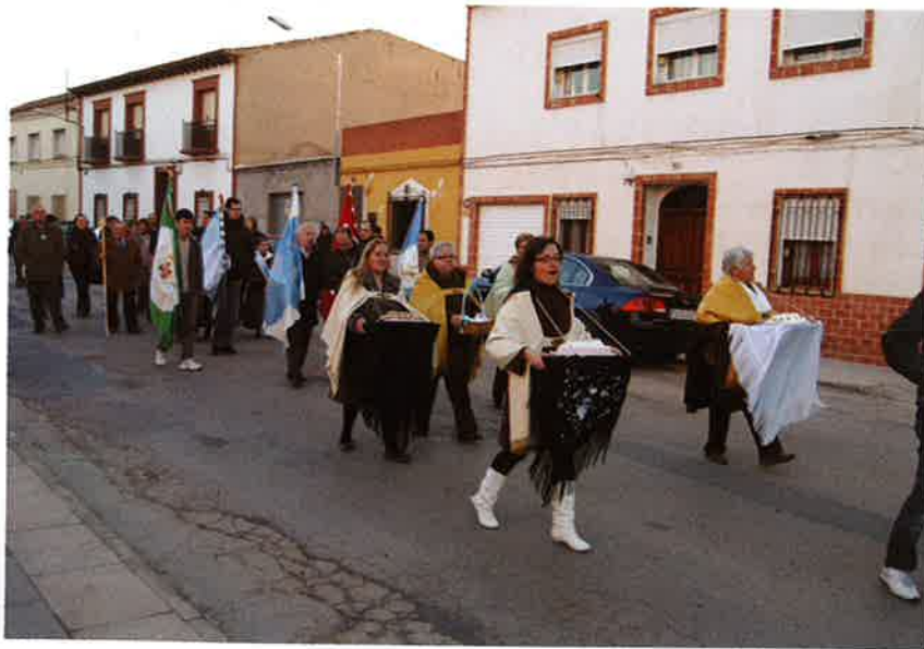
La familia oferente de la Candelaria se dirigen hasta el Templo, según tradición.

A comienzo del mes de febrero, como es tradicional, celebramos una de las fiestas más entrañables como es la Fiesta de la Candelaria, en primer lugar, con la procesión con la imagen de la Virgen a hombros de sus devotos/as alrededor de la Plaza de Santa María y en segundo lugar, la función de la Candelaria, momento muy importante cuando los padres con sus hijos e hijas en brazos los suben al altar, bajo los pies de la imagen de la Virgen, ofreciéndoselos/as y pidiéndole para que los cuide y proteja de todo mal durante toda su vida, ¡qué bonito deseo!