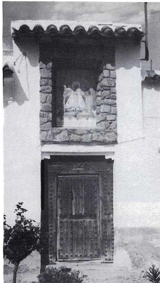
Una estampa retrospectiva de nuestra Ciudad. Calle Mediodía, frente a la taberna de Lizcano.

ASI ES EN LA ACTUALIDAD - FINALES DEL SIGLO XX