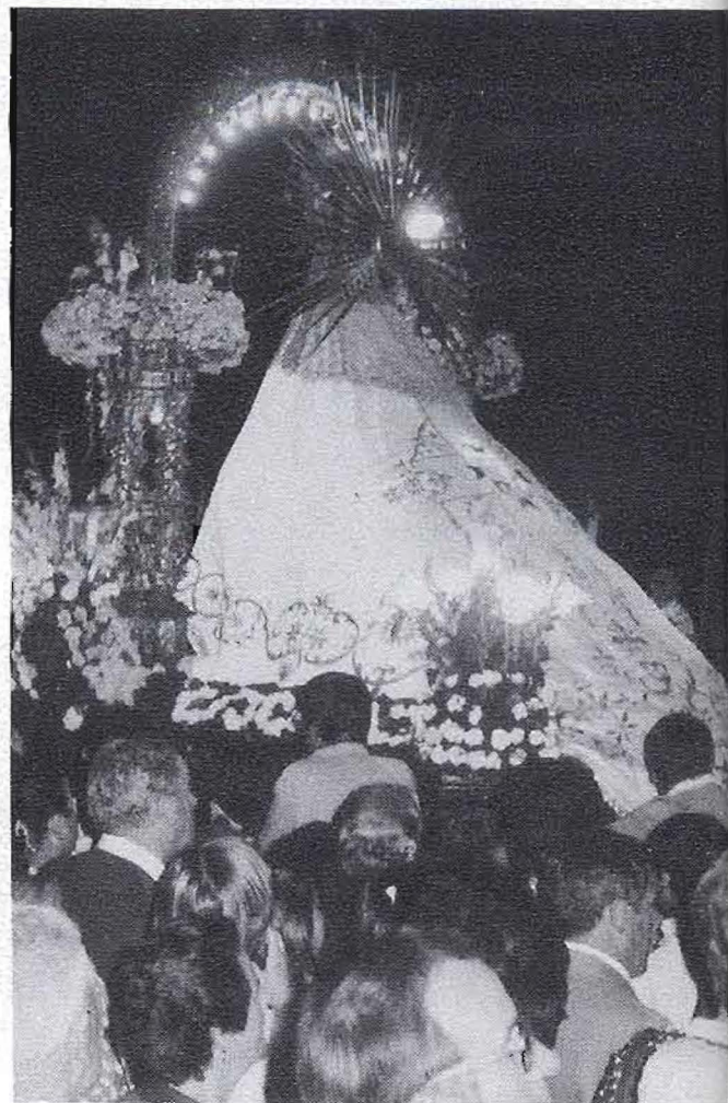
El pueblo se apiña para ver la entrada de la procesión