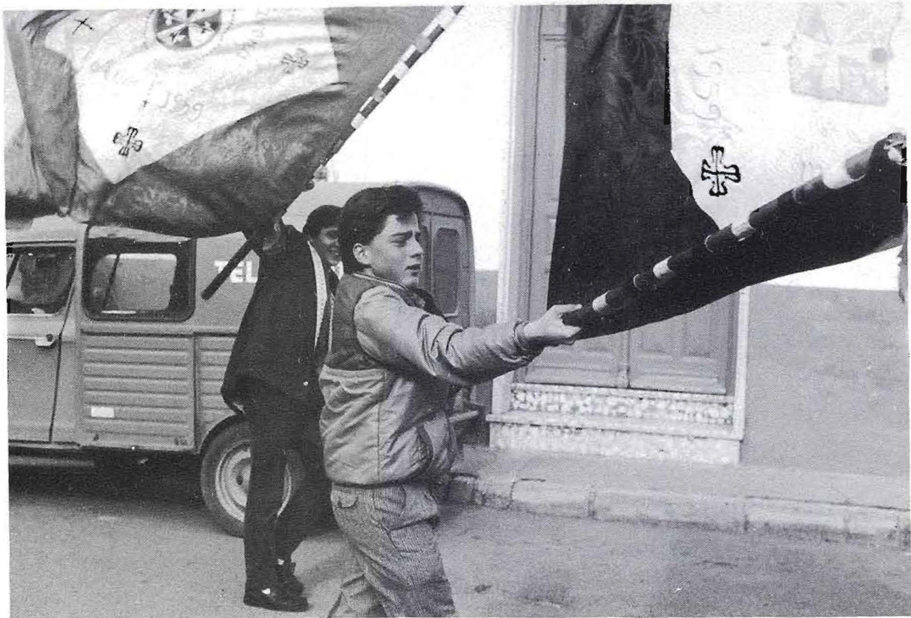
Los jóvenes echan las banderas, según el estilo tradicional