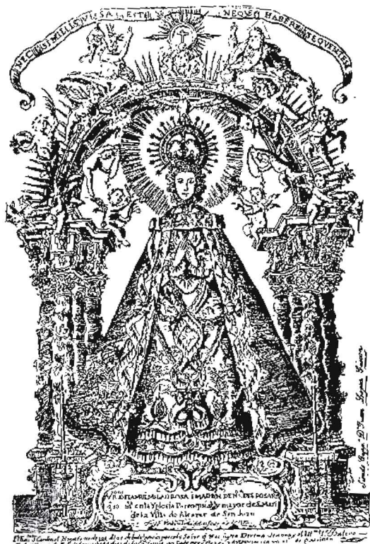
Grabado aludido en este artículo

penden varios rosarios y Nuestra Señora luce una corona rodeada de estrellas. Sobre el conjunto, delicadamente ejecutado, campea una orla con la inscripción latina: NECSIMILLIS VISSA EST NEQUE HABERE SEQUEMTEM. "