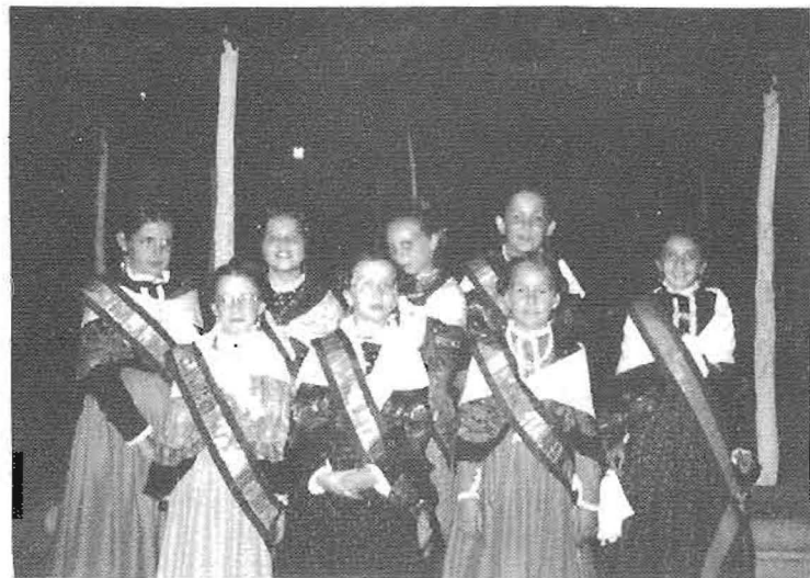
Las Damas de Honor Infantiles del pasado año ataviadas con el traje Regional Manchego