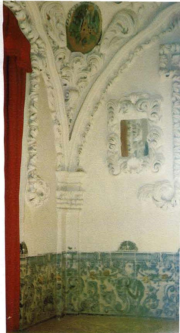
La piedad popular erigió un magnífico Camarín con azulejos talaveranos y filigranas de yesería y espejos

Colocada sobre un trono barroco, culmina con las tres Personas de la Santísima Trinidad y varios ángeles que le ofrecen palmas, flores y dos rosarios. Sobre el manto