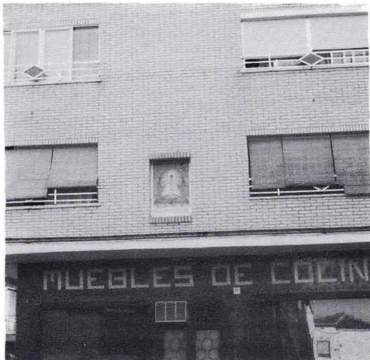
El azaulejo de la Virgen se ha incorporado al nuevo edificio.

(Tomada foto y texto Dr. Mazuecos, fascículo V)