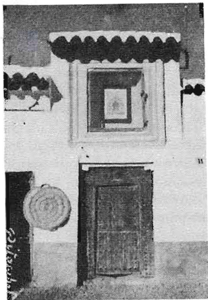
La casa de la Virgencilla del Rosario en la calle del Mediodía, esquina a la de Almagueta. ASI ERA A FINALES DEL SIGLO PASADO

El cariño de los alcazareños hacia su Patrona hizo que, por las calles del pueblo se levantaran capillas murales con estampas de la Virgen del Rosario. El paso del tiempo las deterioró y se reconstruyeron. Las vetustas casas fueron desapareciendo, en algunos casos desafortunadamente, pero en las nuevas edificaciones, surgidas en los mismos solares permanece hoy, afines del siglo XX, la "Virgencilla." En esta página y en las siguientes mostramos cómo eran ayer y cómo son hoy.