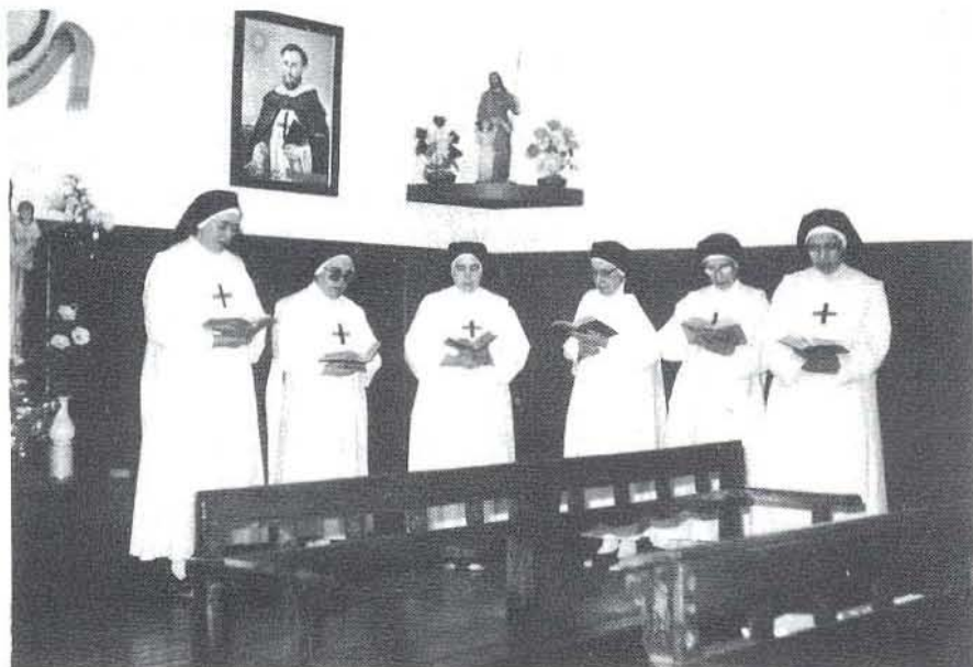
Aspecto parcial del coro, durante el rezo

En la actualidad somos catorce hermanas, que, como decía antes, constituimos, también una realidad humana y social. Además de la oración, nos ocupamos todo el día en trabajos de tipo manual. Con estos trabajos vivimos y nos pagamos nuestra propia Seguridad Social, según la normativa vigente. Hoy la pobreza se identifica con el trabajo y en ese sentido trabajamos para vivir. Entre los trabajos que desarrollamos, merecen destacarse los bordados a mano y a máquina especialmente en oro y sedas, como el manto que ahora