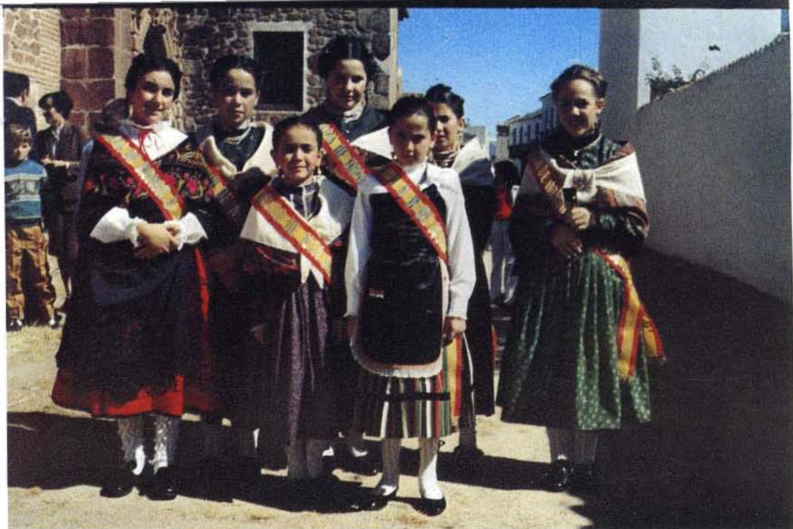
Las Damas de Honor de la Virgen, 1984. La juventud símbolo de amor y paz como dice esta poesía