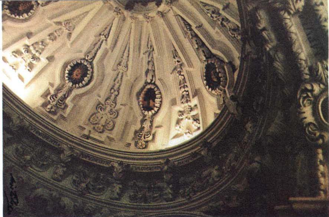
También el Camarín fue una felicitación comunitaria a la Virgen el año 1742 —Vista parcial de la cúpula del Camarín—