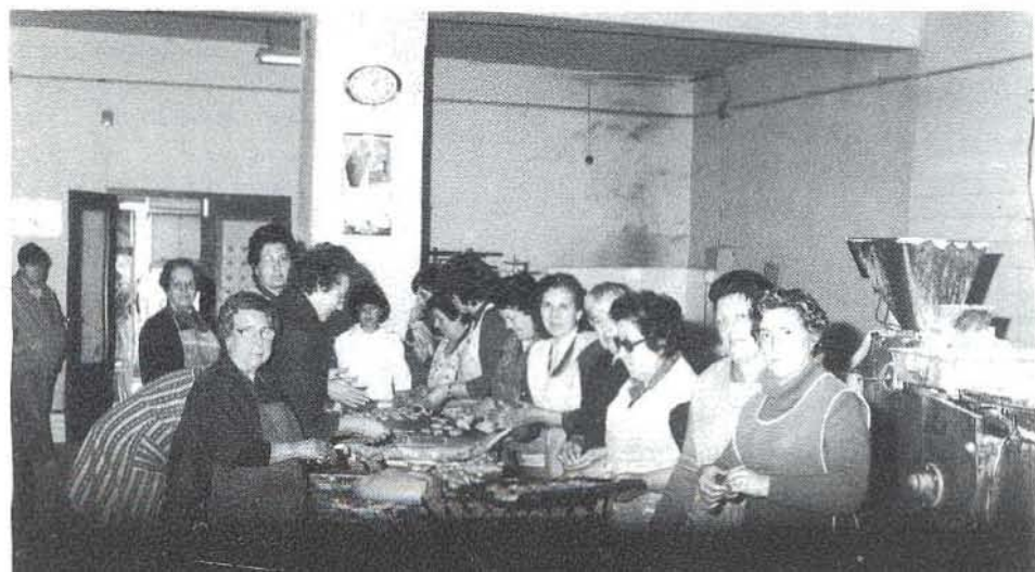
Haciendo las rosquillas en el horno

Como en tantísimos pueblos y ciudades donde se hacen, se les atribuyen virtudes curativas y preservativas y se guardan para comer a lo largo del año si sobreviene alguna enfermedad de la garganta, pero en Alcázar se las comen tiernas para que hagan el efecto de vacuna, en lugar de tenerlas en la orcilla de la alacena, como un potingue cualquiera, guardado para cuando hace falta, cual el árnica, por ejemplo, pero se consumen con tanta fruición que este mismo año han hecho doce seras de vendimiarse de esas grandes hasta la