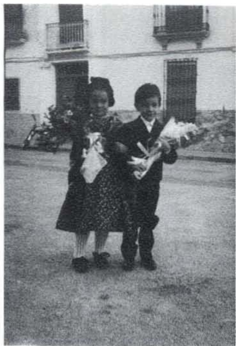
Una pareja de niños van a incorporarse a la comitiva desde su casa.