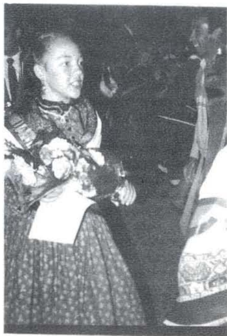
Una joven ofrece sus flores