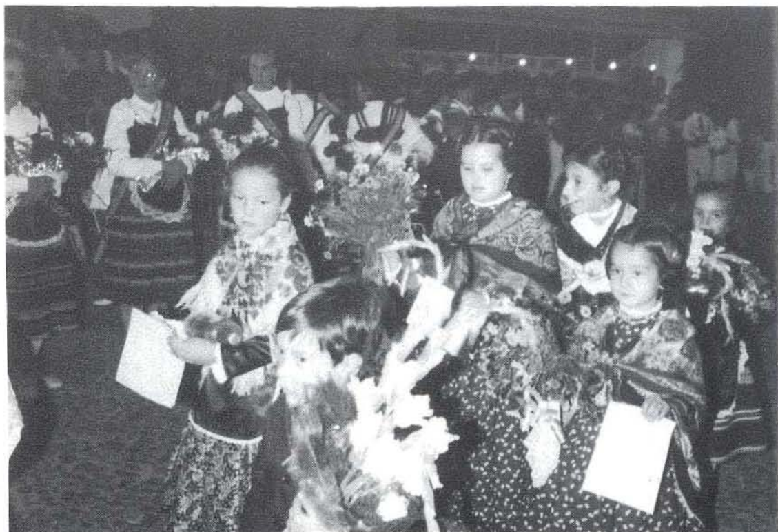
Aspecto del acto de la ofrenda de flores, el pasado año 1984

Las Damas de honor de la Virgen, acompañadas de las Damas de las Fiestas Municipales y otras de diversas fiestas locales, presiden este desfile.