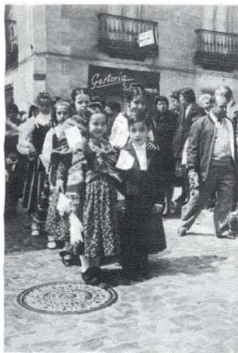
La comitiva a su paso por una calle de Alcázar.