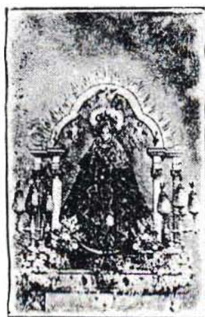
Antigua Imagen y andas de Ntra. Sra. del Rosario