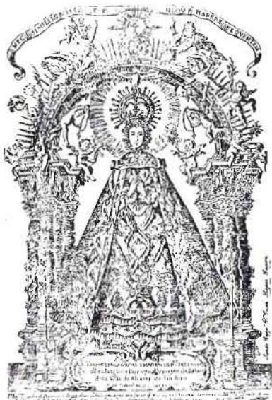
Litografía de Matías Irala en 1731