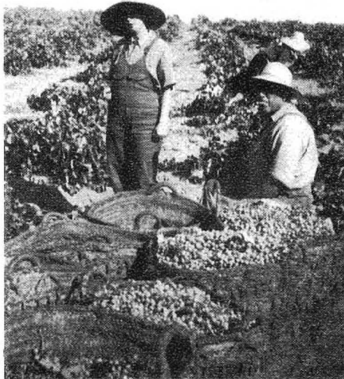
Típica estampa de vendimia. La autora de este artículo con su padre

Porque la Fiesta de la Patrona de Alcázar protege y ampara la vendimia, que es la alcancía donde el agricultor va echando, a todo lo largo del año, sus trabajos e ilusiones. La vendimia se empezaba a preparar en mi casa, apenas pasada la Feria. Se pensaba en preparar la cuadrilla. "Una buena cuadrilla" decía mi padre. Después,