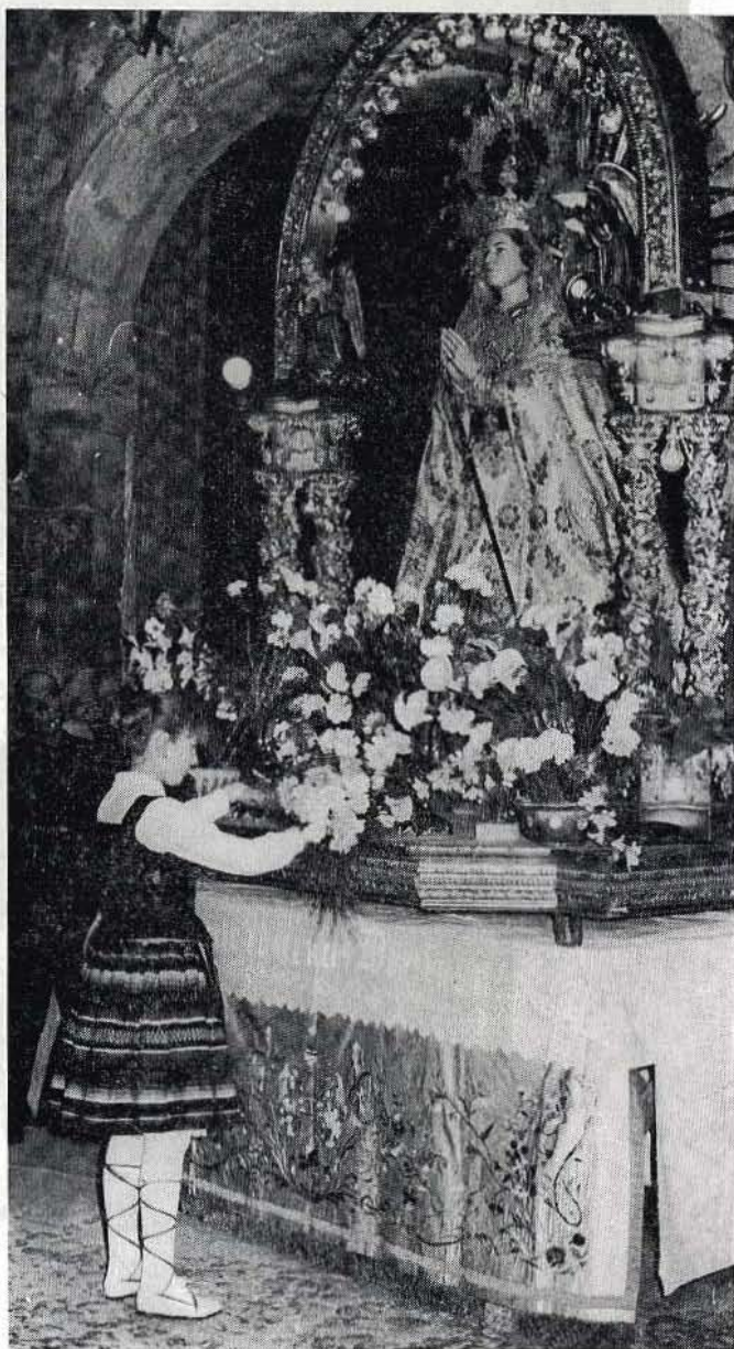
Ofrenda de flores a la Virgen en el acto del Pregón del Festival.