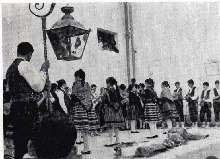
Grupo folklórico de Santa Cruz de la Zarza, cantando los "mayos"

Virgen del Rosario, de este pueblo luz, te traemos flores desde Santa Cruz.