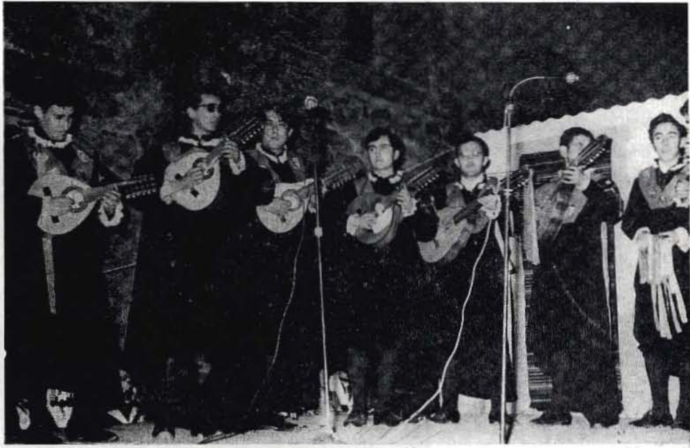
Actuación de las rondallas ante la Virgen del Rosario en la noche del 30 de abril