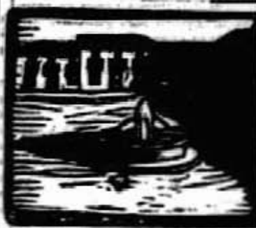
PASANDO EL RATO

Niels Lyhne es todo el Norte despertando un Norte de primavera, grandes salices tílicos, luego de chimeneas sobre la silenciosa lluvia que bate en los cristales, árboles apenas florecido, olor a resinas, deshielo y es, además, una evocación de los ensueños adolescentes pleno de nebulosas e incertidumbres. Obra utilísima y a veces indispensable para el pedagogo y el pedagogo, el psico-analista y el simple lector curioso.