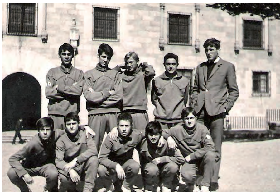
Equipo RENFE Infantil (1967)

Todas las eliminatorias se resolvieron favorablemente en este orden; Día 5, Alcázar 35-León 24; Día 6, Alcázar 45-Zaragoza 16; Alcázar 35-Madrid 26 y la final Día 7, Alcázar 34-Melilla 30, proclamándose CAMPEÓN DE ESPAÑA INFANTIL de 1967.