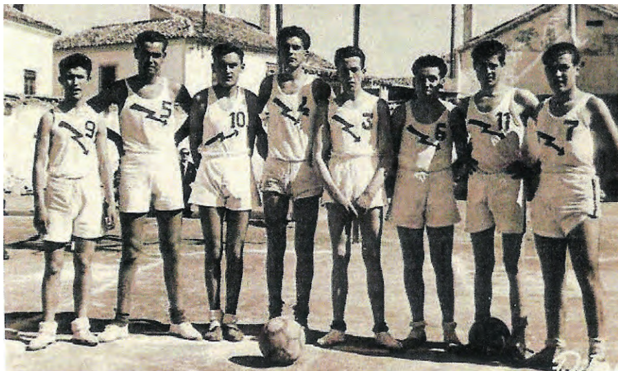
Equipo HÉRCULES C.B. (1954).