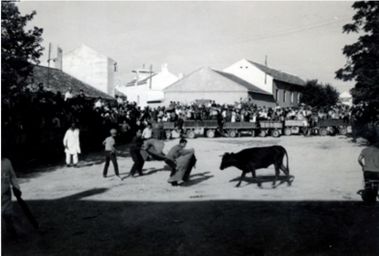
Suelta de vaquilla años 60.

En el segundo tercio del siglo XX, las personas aficionadas a la fiesta del toro o que querían triunfar como toreros, junto con la hermandad se hacían cargo de los costes, por ello era tradición que los alamedeños compraran carne de la res, destinando los beneficios para sufragar los costes de la compra de las reses. A mediados de los años ochenta, esta tradición finaliza, puesto que a partir de este momento, será la comisión de festejos de la localidad, la encargada de la adquisición de las reses.