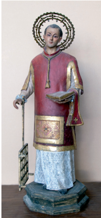
Antigua imagen de San Lorenzo años 40.

Respecto a la imagen de San Lorenzo, debemos incidir que la imagen procedente de la ermita de Villacentenos desaparecerá en la Guerra Civil y a la cual le sustituye una pequeña talla de San Lorenzo, de unos 80 centímetros de madera, de la que no tenemos constancia de su procedencia, tan solo que será venerada en la iglesia parroquial hasta su traslado hacia 1957-1958 por la compra de una segunda talla de mayor tamaño.