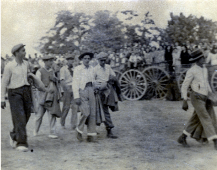
Suelta de vaquillas años 40.

Por ultimo, pero no menos importante y muy ligado a las fiestas en Alameda de Cervera, destaca la tradicional suelta de vaquillas, en honor a su patrón. Las noticias que tenemos, nos permiten situar dicha tradición a finales del siglo XIX, por la presencia de ganado vacuno en la zona. Esta tradición tan solo será interrumpida durante el transcurso de la Guerra Civil Española (1936-1939).