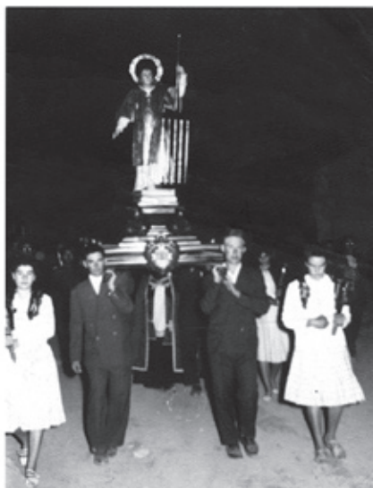
Imágenes procesión. (izquierda años 40), (derecha años 60).

Sin embargo, con el tiempo, esta tradición se ha transformado en parte, ya que por la mañana del citado día se realiza la eucaristía y por la noche, sale en procesión la imagen del santo por las calles de la localidad, acompañado por la población, para concluir la citada procesión, con el beso de la reliquia.