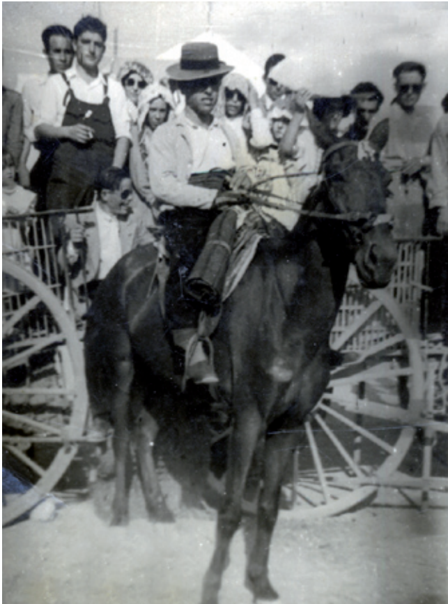
Suelta de vaquillas años 40.