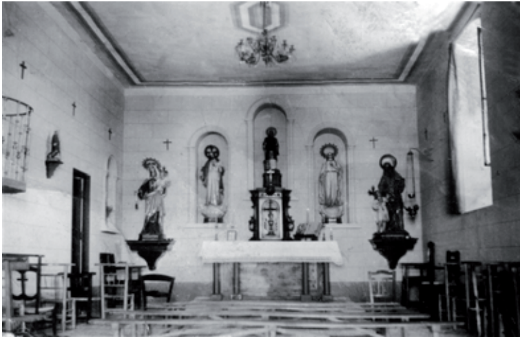
Ermita años 40.

habitación adosada, la cual serviría de sacristía. Por lo que respecta al frontal, podemos señalar que estaba compuesto por tres arcos de medio punto donde estaban ubicadas diferentes imágenes religiosas del Sagrado Corazón de Jesús y de María y en la parte central la imagen de San Lorenzo Mártir, adquirida en los años 40. Destaca en conjunto una decoración bastante diáfana y austera, propia de la época de posguerra.