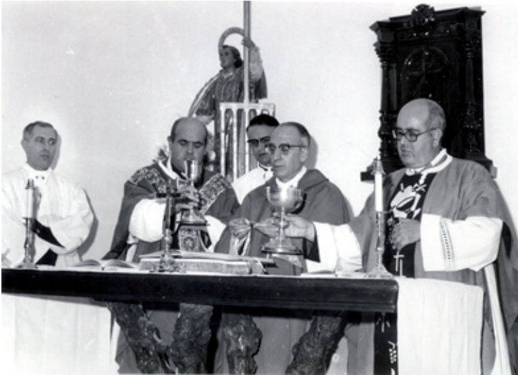
Bendición de la Iglesia de San Lorenzo.

en la parte delantera del altar de una pequeña viga de madera cuya única decoración es una cruz. La zona de los laterales es totalmente recta, manteniendo la ubicación de la sacristía en la parte superior izquierda.