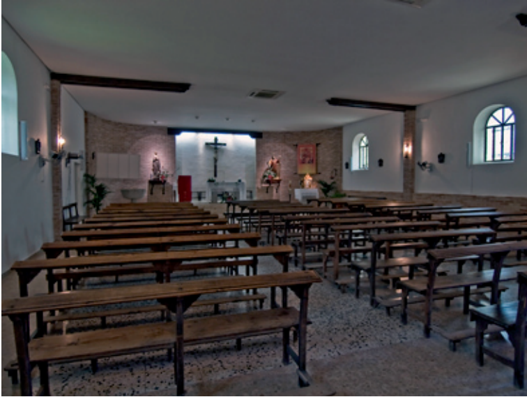
Imagen actual de la Parroquia.

De esta ermita proceden las losas de granito que constituyen el altar, sagrario y pila bautismal, de la iglesia de San Lorenzo, ya que dicha ermita, se encontraba cerrada al culto y en condiciones bastante precarias.