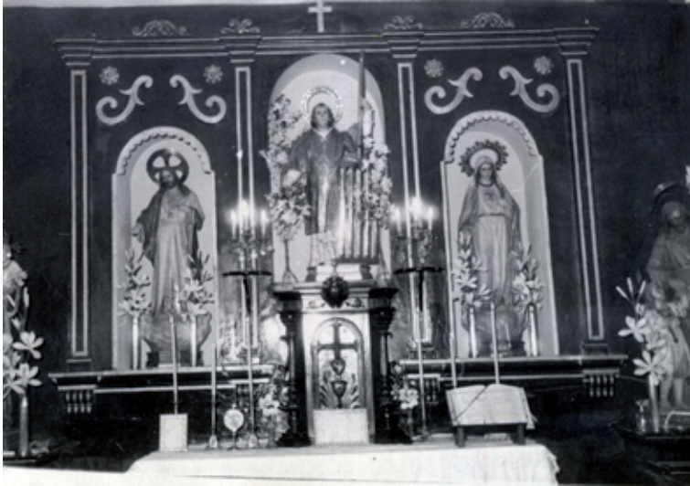
Retablo años 50.

Años después se construye un retablo para albergar las imágenes, del que podemos señalar que mantiene la estructura de ornacinas antiguas, pero ahora vemos como tiene una decoración más rica, donde aparece una mayor policromía y dorados con algún motivo de tipo vegetal para resaltar su ornamento. En esta fotografía ya vemos la nueva talla de San Lorenzo que es la que permanece en la actualidad.