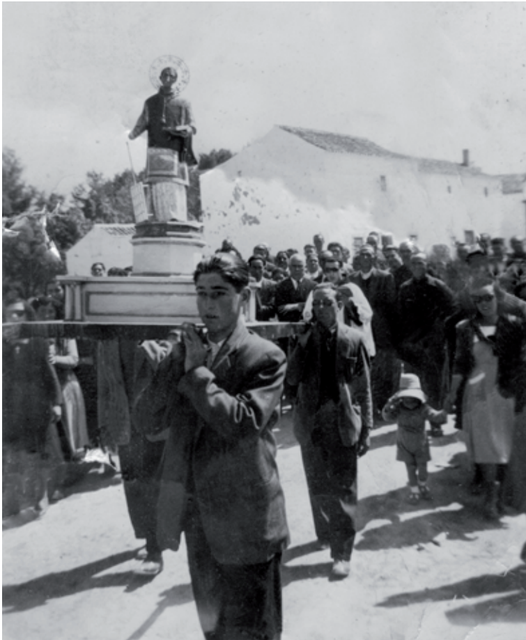
Procesión años 40.

Para poder realizar la compra de la nueva talla, se organizó una junta en el casino del pueblo, asistiendo a la misma los hermanos, vecinos y la Junta de Hermandad, que estaba compuesta de la siguiente manera: