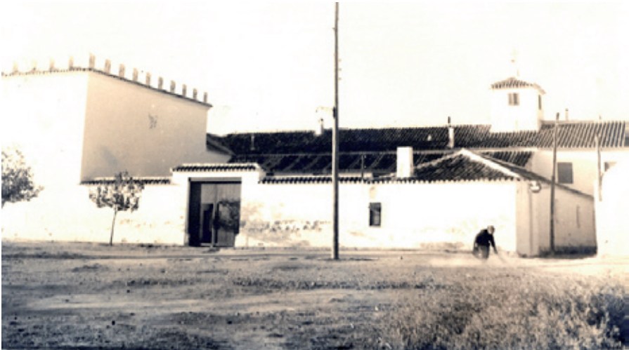
Castillo de Cervera años 60.

En referencia al pozo de "El Egido o Exido" debemos aludir que este pozo se caracterizaba por tener forma ovalada cortado por la mitad, decorado de blanco a similitud de los bombos manchegos típicos de la zona. Sirvió de gran alivio para la población cuando hacia el año 1880 el pueblo se vio afectado por una gran sequía, ya que fue uno de los pocos pozos que tenían agua dulce para poder beber. Posteriormente en 1940 quedaría en desuso por no tener agua y entorno a 1980 sería derruido al construir la actual carretera que divide la localidad de Alameda de Cervera.