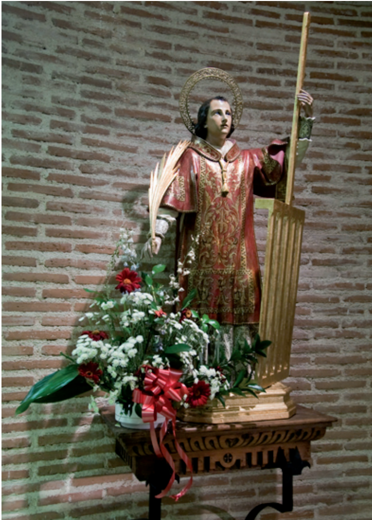
Actual imagen de San Lorenzo.

Por otro lado y en relación con la Junta de Hermandad inicial, debemos de añadir que no se ha dado de baja nadie, ya que la mayoría de sus componentes en la actualidad viven, aunque en nuestros días el funcionamiento de la hermandad es