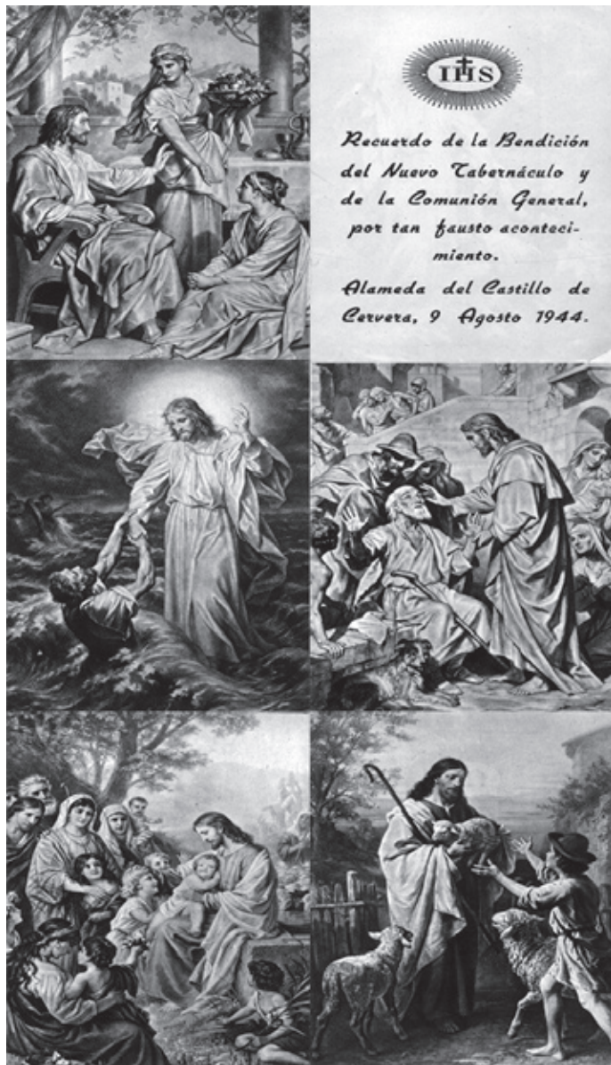
Recordatorios de la bendición del tabernáculo.